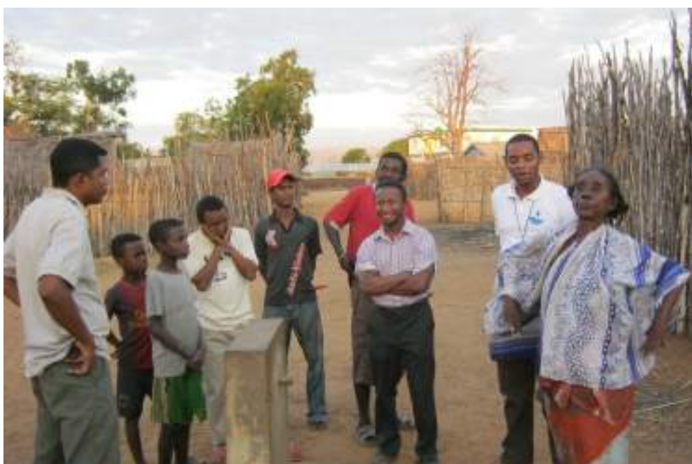
Village de Befandriana, Région Atsimo Andrefana, Madagascar

Version provisoire avant validation de l'Assemblée Générale