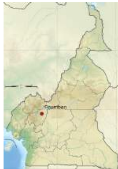
Figure 1 : Carte de localisation Foumban

Les habitants de Foumban sont répartis de manière inégale dans 34 villages, pouvant être classés en deux pôles : le pôle urbain, au centre de la commune, qui compte 18 villages et abrite la majorité de la population, et le pôle rural, qui compte 16 villages entourant le centre urbain.