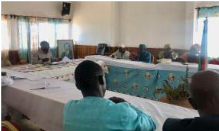
Figure 4 : Formation des structures de pré-collecte

formation théorique à la pré-collecte : ce fut l'occasion de revoir les principes fondamentaux de la pré-collecte, notamment l'esprit d'entreprise qui doit l'accompagner, et de discuter du fonctionnement du service.