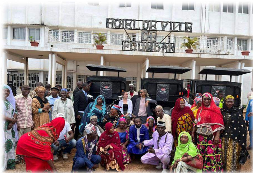
Cérémonie de réception du matériel à Foumban