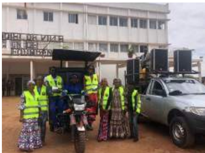
Figure 11 : Caravane de sensibilisation

La campagne IEC doit se poursuivre jusqu'en fin d'année 2023.