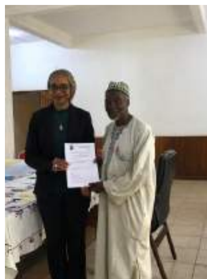
Figure 3 : Signature des conventions de délégation

Ces associations ont signé une convention de délégation de service avec la Commune lors d'une cérémonie en présence du Maire de Foumban. Elles ont ensuite bénéficié d'une journée de