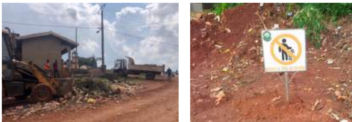
Figure 10 : Eradication d'un dépôt sauvage par la Commune (avant/après)

Ce nettoyage a été réalisé, malgré d'importantes difficultés liées à la disponibilité du carburant et à l'état d'usure du matériel. Cela a permis aux structures de pré-collecte de lancer leur service tour à tour : le 3 août, le service était opérationnel dans les cinq quartiers.