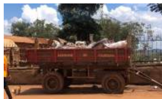
Figure 7 : Bac communal servant de dépôt intermédiaire

Ces dépôts intermédiaires seront ensuite collectés par la Commune, qui se chargera de transporter les déchets jusqu'à la décharge municipale. Chaque quartier aura son propre dépôt. Ils prendront la forme d'un bac (voir photo ci-contre) qui pourra être tracté par le tracteur de la Commune. La Commune dispose de 10 bacs de ce type, dont certains ont été réparés par le projet, grâce aux économies réalisées lors de l'achat des tricycles. Les bordures doivent également être réhaussées pour augmenter leur contenance.