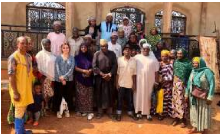
Figure 8 : Discussion avec les populations dans le quartier de Manka

d'emplacement. Les propositions ont été étudiées par la Commune de Foumban, avec l'appui d'ERA-Cameroun et d'Experts-Solidaires, afin de s'assurer que les sites étaient accessibles aux tricycles et engins de la Commune, techniquement viables et, dans la mesure du possible, évitaient les zones de concentration de population.