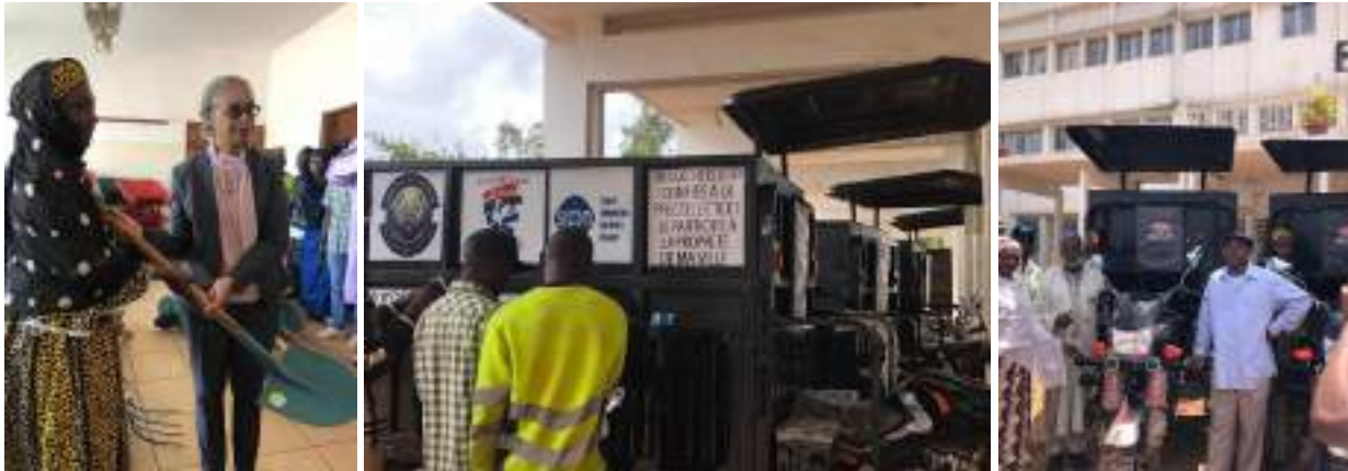
Figure 5 : Cérémonie de réception du matériel et remise symbolique aux associations