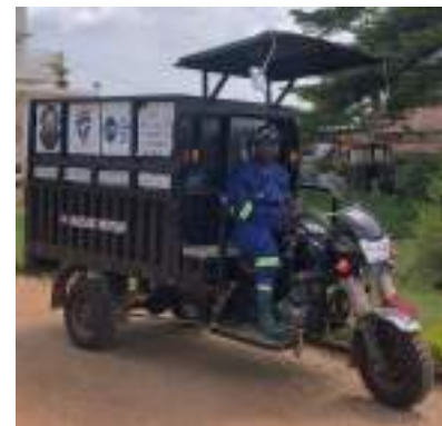
Figure 6 : Conducteur recruté, formé et équipé

Dans les quatre quartiers où le service sera délégué à des associations, c'est l'association qui prendra en charge ces frais, en versant à la Commune une somme mensuelle pour couvrir leurs salaires.